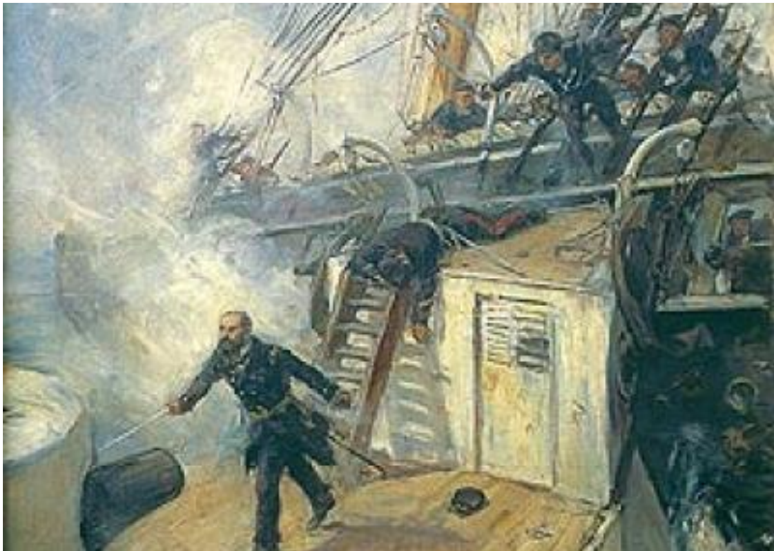
Grau el Hermano Mason que es admirado también en Chile.

El 21 de mayo de 1879 Prat muere en la cubierta del Huáscar junto al sargento Aldea, la Esmeralda se hunde con la bandera al tope y de los 198 marinos de su tripulación mueren 142 .