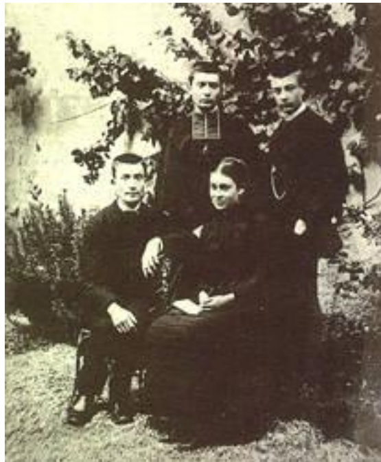
Mercedes Cabello de Carbonera.

sus últimos años lo pasó recluida en el Manicomio del Cercado de Lima hasta que falleció en 1909.