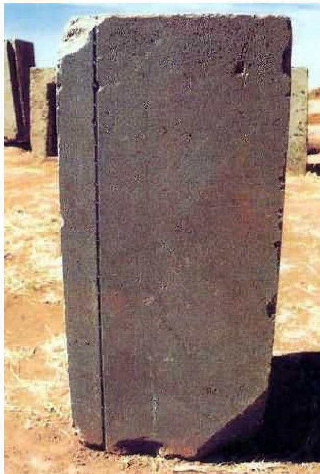
Piedra en proceso de tallado en Tiahuanaco.

Lo que debemos remarcar de la narración de Pedro Cieza, es que su crónica no tiene apego a las tradiciones locales, porque era español, y no demuestra en su obra ninguna simpatía o aversión para tergiversar lo que vio o escuchó, sin embargo cuando trata de las guerras civiles entre españoles, su pluma expresa su pensamiento personal y sus simpatías.