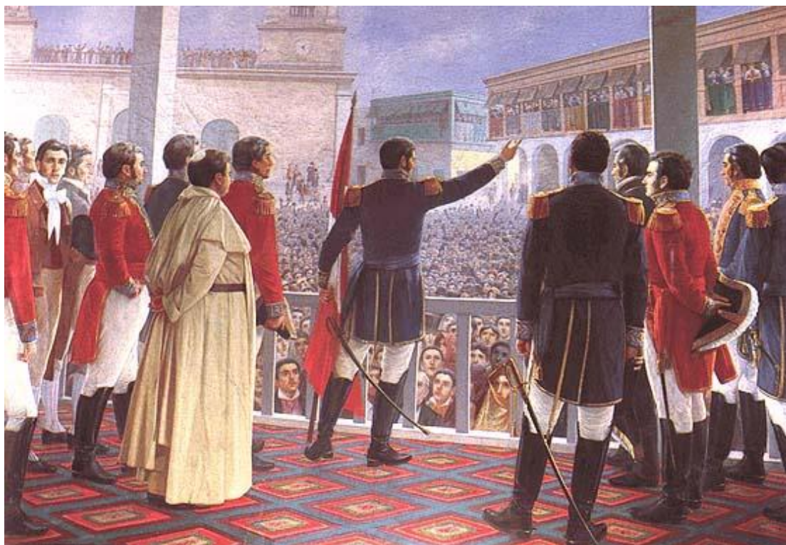
San Martín Proclama la Independencia del Perú.

que en esta misma América Morena, de tanto en tanto, se haya retrocedido a períodos de Tiranía y Opresión.