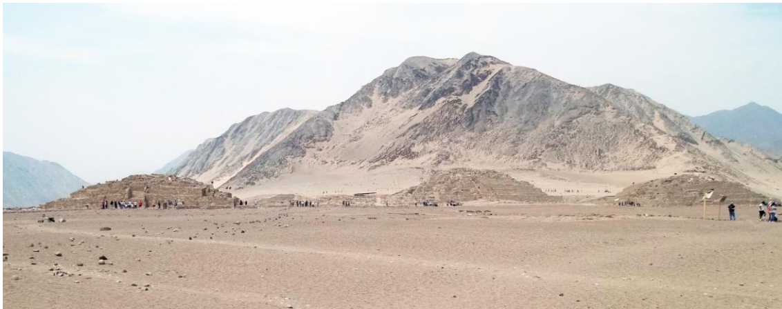
Las Piramides de Caral.

Hablar de los Incas, es referirse al Imperio del Sol y del Tahuantinsuyo, y junto a el asociar las características constructivas de sus obras arquitectónicas cuya expresión más refinada es Machu Pichu, sin embargo entre el periodo de aparición de Tiahuanaco y la fundación del Imperio del Sol, existieron otras culturas cuyas construcciones hoy empiezan a asombrar al mundo no solo por su tecnología, sino también por su antigüedad y esto es Caral.