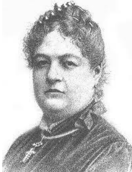
Clorinda Mattos de Turner.

populares instigadas por el clero asaltaron su casa, incendiaron su efigie y quemaron sus libros, que fueron prohibidos. Esta novela fue controversial porque narra la historia de amor entre un hombre blanco y una bella mujer indígena, quienes no pudieron casarse al descubrir que eran hermanos, hijos de un mismo padre, un sacerdote mujeriego y porque habla de la inmoralidad de los sacerdotes en aquella época. Estos fueron momentos muy difíciles de su vida, y no fueron muchos los que se atrevieron a defenderla y apoyarla públicamente.