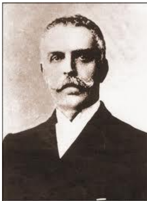
Manuel Gonzáles Prada.

El liberalismo impregno de “fraternidad” a las instituciones que se desarrollaron en la reconstrucción, la elevada dosis de filantropía y patriotismo dieron lugar por ejemplo a que con distintas donaciones se reconstruyera la Biblioteca Nacional, en esta actividad estuvieron comprometidos los masones y bomberos de Lima y Callao, los que dinamizaron sus actividades para reemplazar a sus miembros que murieron en la guerra. Los sobrevivientes con gran entusiasmo hicieron llamamientos a la juventud, quienes respondieron y cooperaron en el levantamiento de la “decana de las bombas”