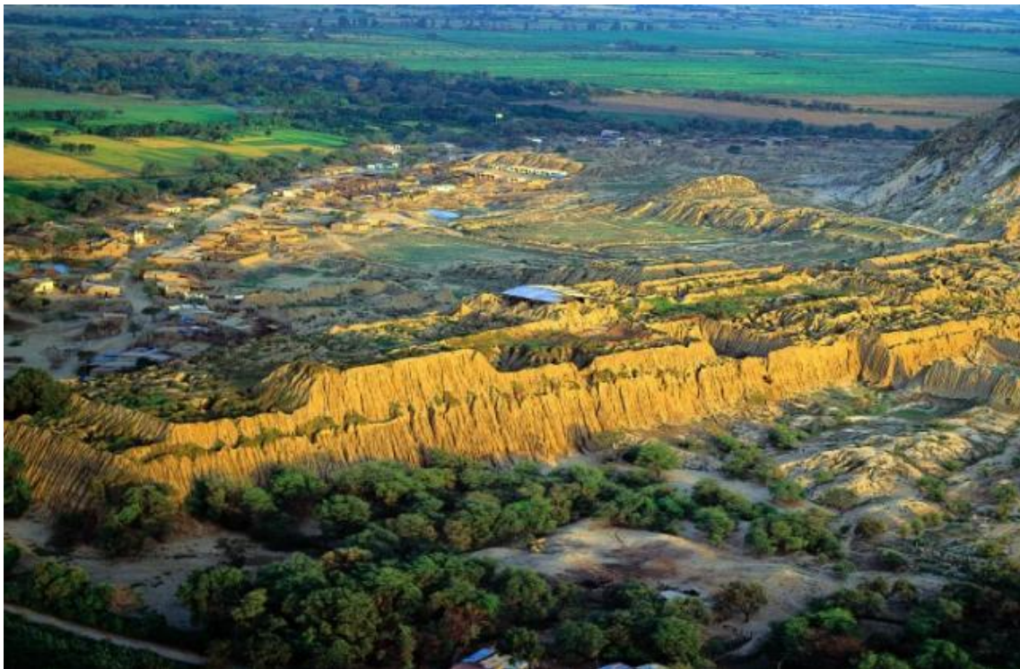
Pirámides de Tucume.

La cultura Sican construyó muchas pirámides con adobes de barro producidos con moldes y en serie, siendo la más representativa la de Túcume, fundado por Naymlap, héroe mítico que vino del mar en una flota de barcos, con su corte, servidumbre y fuerza militar. Se adentró en el valle y organizó en la periferia de la nación Moche un estado poderoso que fue capaz de movilizar por centurias a grandes cantidades de campesinos para la construcción de colosales palacios y extensas ciudades sagradas. Túcume está formado por 26 pirámides y decenas de edificios más pequeños, todos reunidos en torno al Cerro la Raya, un enorme hito pétreo en la inmensurable llanura que es ese fértil valle de La Leche en el norte de Perú. (Herbert Oré, Sociedades Inicáticas : http://es.scribd.com/doc/48606535/Sociedades-Inicaticas-por-Herbert-Ore , Año 2010, Pág. 29)