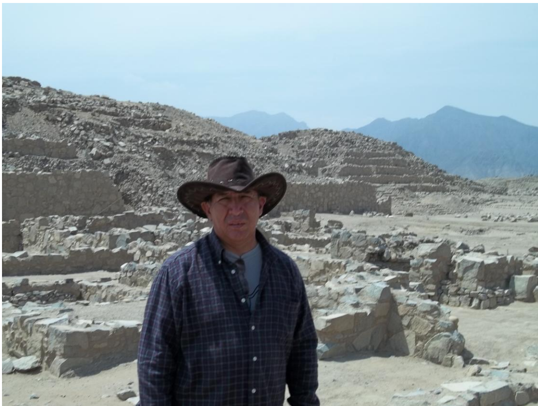
Las pirámides y los restos de las viviendas de los constructores de Caral.