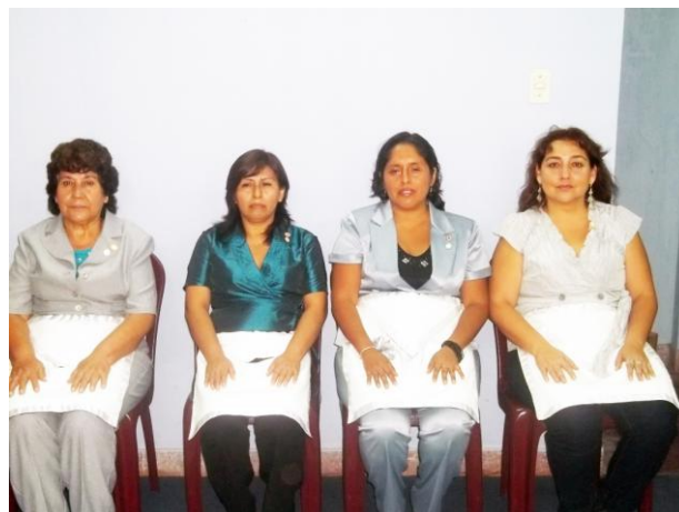
Masonas del Triángulo Masónico Mampira N° 23 La Merced, Junín, Perú.

Pero la presencia de la mujer en la masonería peruana, ha generado diversas opiniones, algunos se oponen y otros aceptan su participación, así en nuestro medio hay muchas logias mixtas, donde la mujer trabaja con las mismas obligaciones y derecho masónico, sin embargo logias femeninas son pocas aún.