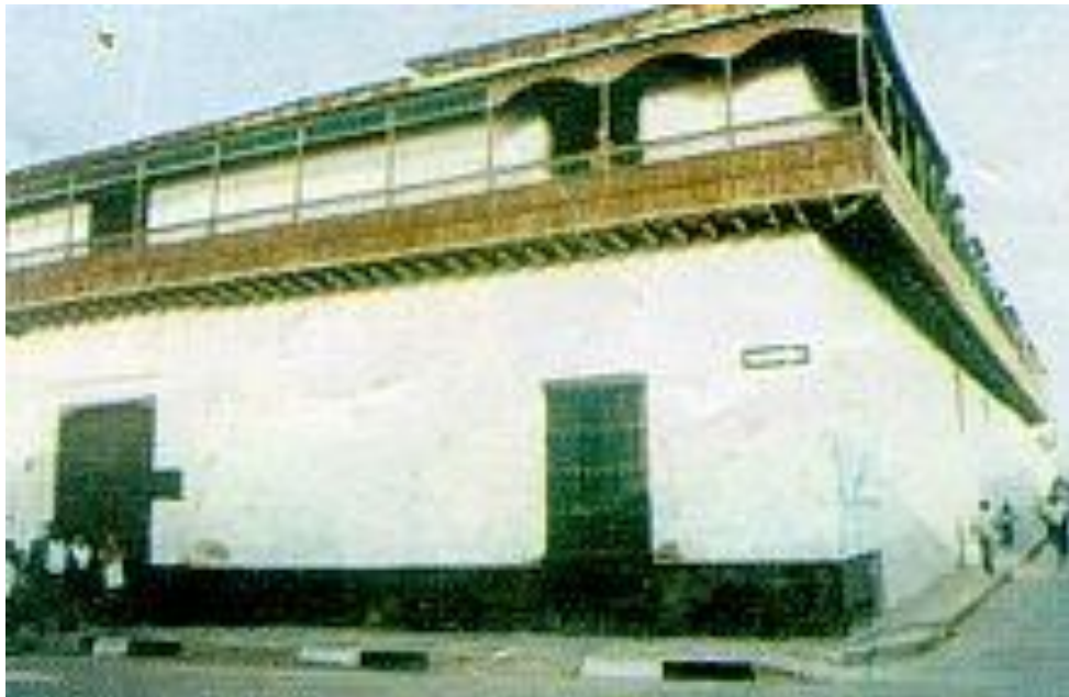
"Casa Montjoy" o "Casa de los Masones" Lambayeque – Perú.