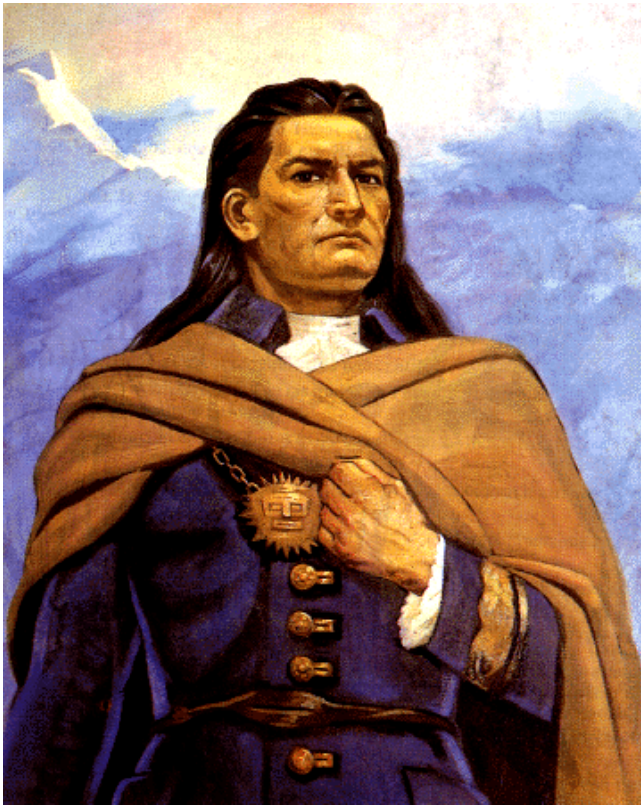
José Gabriel Condorcanqui y Noguera

Podemos decir que en relación de José Gabriel Condorcanqui y Noguera o "Tupac Amaru II" habría mayores manifestaciones de relación masónica y que incluso en su casa del Cuzco ubicado en el sector de Mutachacca (Hoy Avenida del Sol) se han encontrado ornamentos masónicos de segundo y tercer grado, los cuales hoy se encuentran en poder de la R.: L.: S.: "Koricancha" No. 40 del Vall.: del Cuzco; y, respecto a Tomás Tupac Catari sí estaría mas definido sobre su formación masónica.