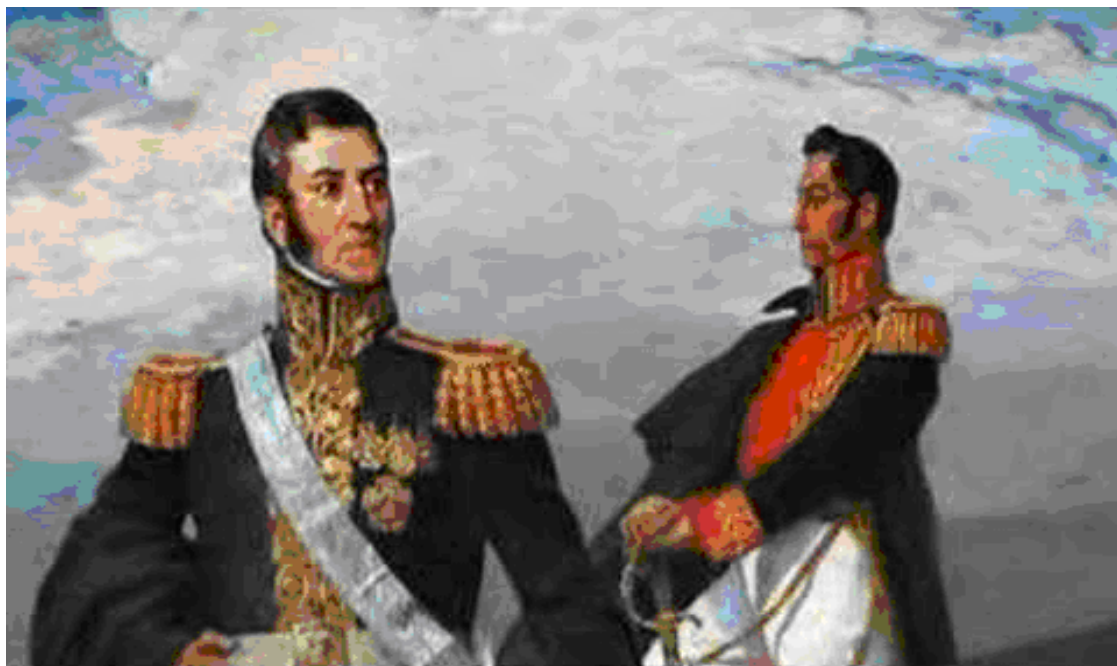
San Martín y Simon Bolívar.

Es evidente que el ingreso de San Martín a la ciudad de Lima no fuera necesariamente después de la medianoche, sino más bien después de una reunión logial entre masones peruanos y españoles. La particular privacidad de a puerta cerrada de la reunión en Guayaquil entre San Martín y Bolívar es una manera discreta de decir que fue a cubierto de toda indiscreción profana.