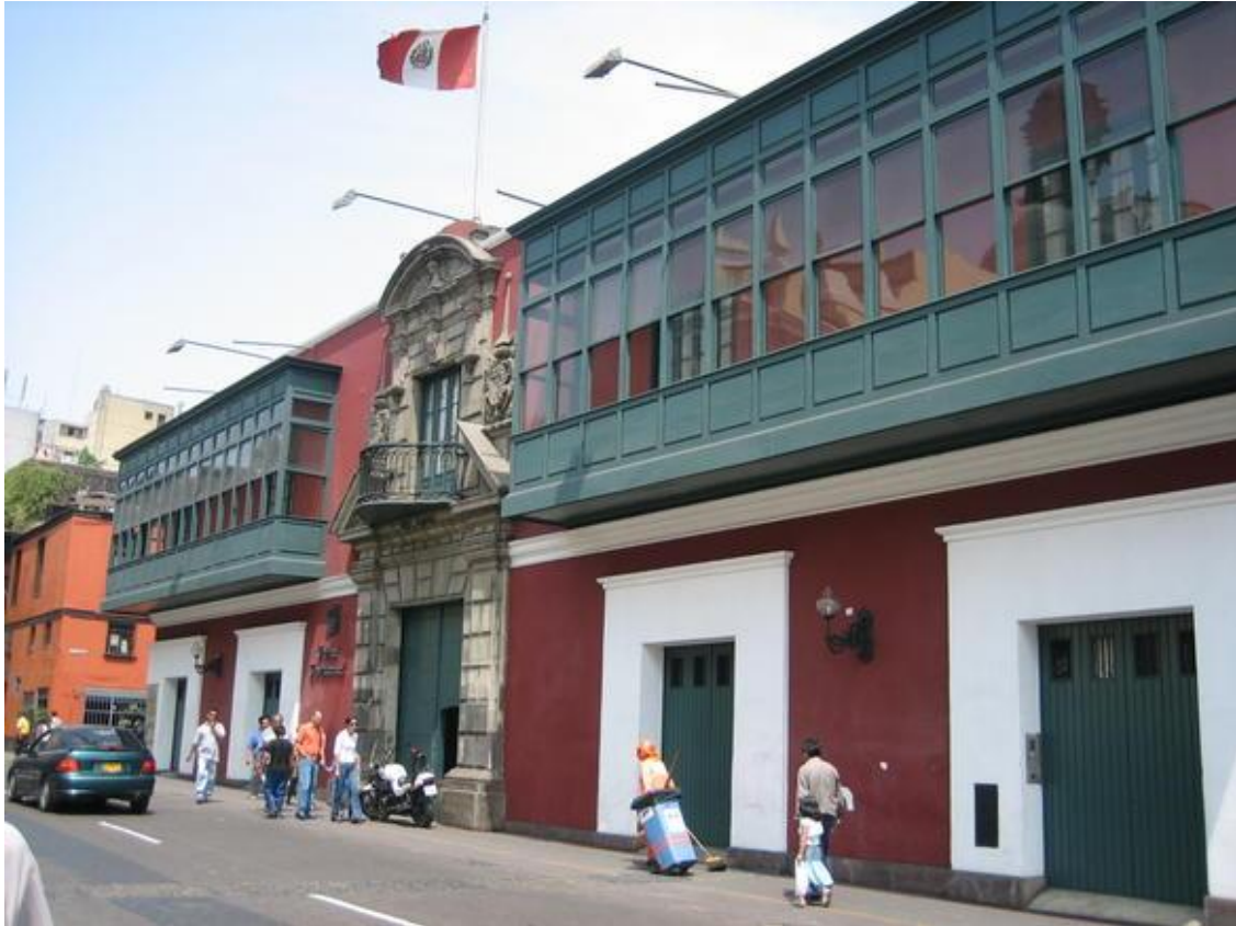
La Casa de Pilatos - Lima - Perú.