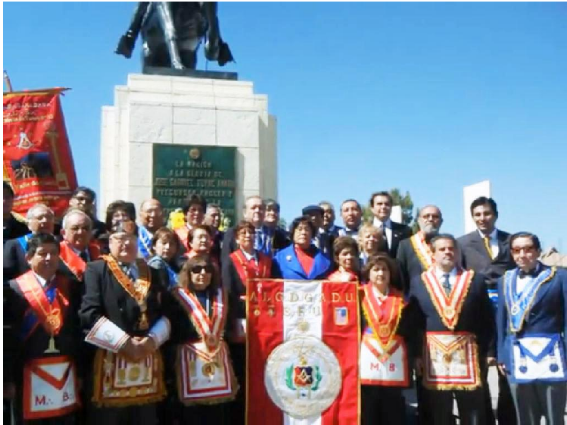
Masones de la Gran Logia Constitucional del Perú en el Cuzco 2010.

R.:L.:S.:Constructores del Templo N° 17 R.:L.:S.: José Martí N°18 (Cuba) R.:L.:S.: Constitucional de Choroteca N° 19 R.:L.:S.: Apodictica De La Plata N° 20 (Buenos Aires) R.:L.:S.: Ortodoxa de Franc Masones Aurora N° 21 Triangulo Masónico Mampira N° 23 La Merced – Junín.