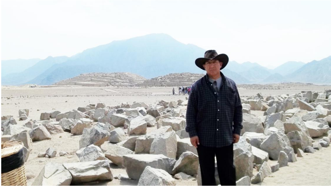
Conjunto de Pirámides de Caral.

Es común cuando hablan del Perú, mencionar solo las obras constructivas de los incas y soslayan las otras culturas peruanas que construyeron imponentes pirámides como las de Caral (3000 ac) cuya antigüedad es similar a la de los sumerios, y ambas son anteriores a los egipcios y mayas. Este tema es tratado ampliamente en nuestro trabajo "La Atlantida y el Nuevo Mundo" http://es.scribd.com/doc/51183921/Herbert-Ore-La-Atlantida-y-El-Nuevo-Mundo .