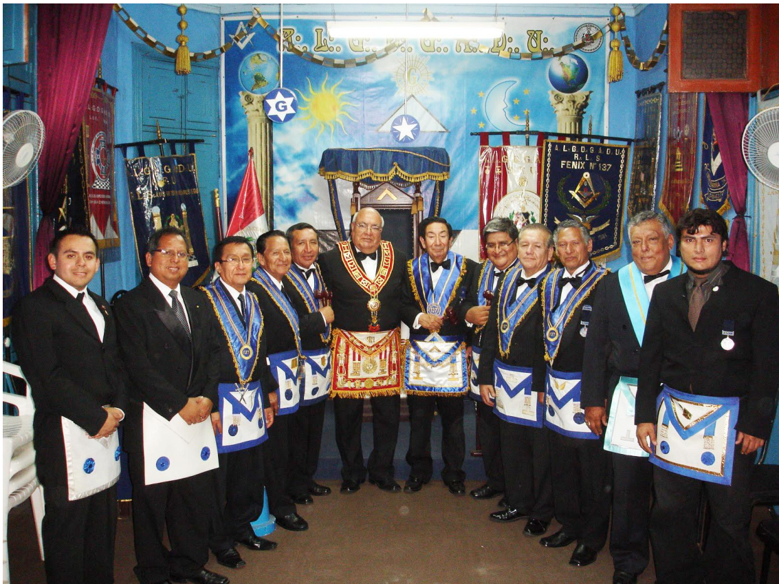
Masones de la P.:F.:C.:B.:R.:L.:S.: Fénix 137-1 – Gran Logia Constitucional del Perú. Las logias jurisdiccionadas a la Gran Logia Constitucional del Perú son:

(Apuntes de la historia de los Masones Antiguos, Libres y Aceptados del Perú – GRAN ORIENTE DEL PERU- Por H.: Orrego Sevilla, Juan 33°.)