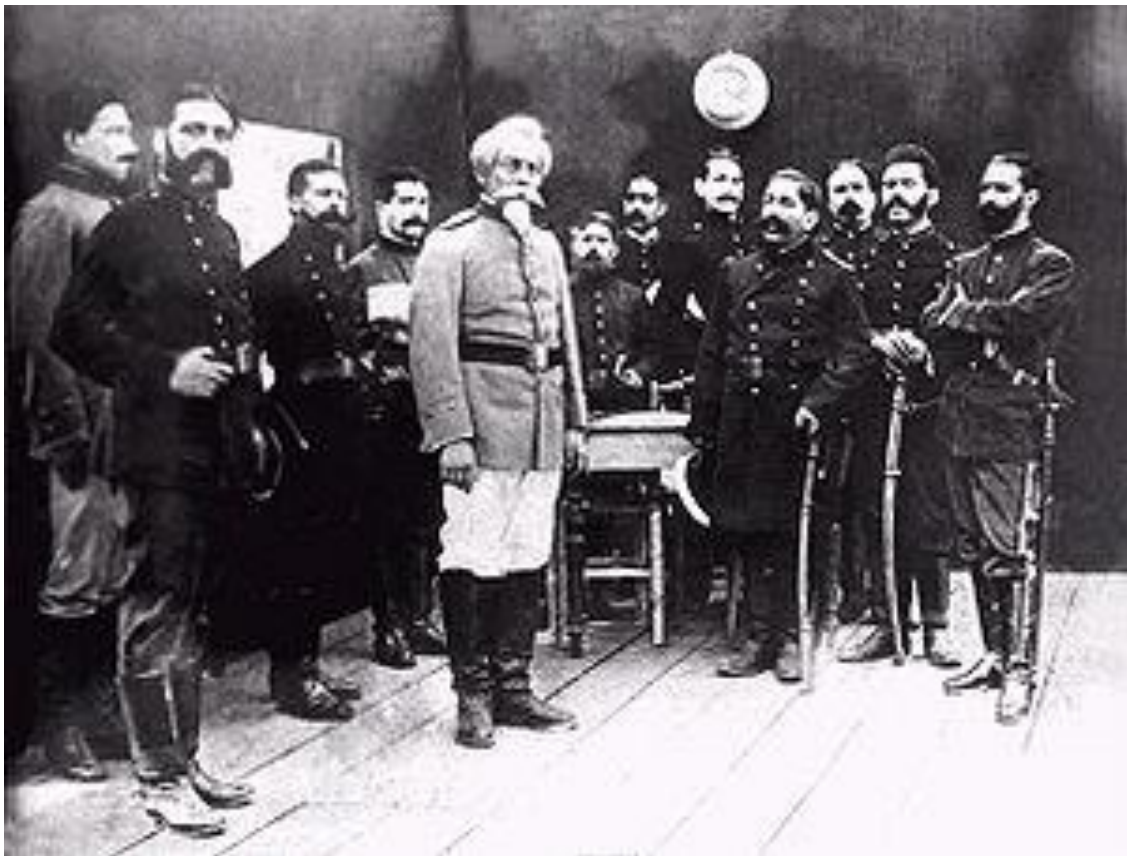
Francisco Bolognesi y sus Oficiales en Arica.

Así como Grau otros muchos militares también fueron masones como el M. :R. :H.: Emérito Francisco Bolognesi Cervantes, presentado en la R.:L.:S.: “Virtud y Unión” el 31 de julio de 1860, siendo en dicho Tall. : En donde recibió los tres grados de la Masonería simbólica.