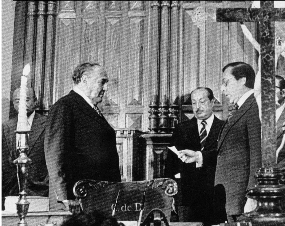
Haya De La Torre, juramenta como Presidente de la Asamblea Constituyente del Perú 1978.