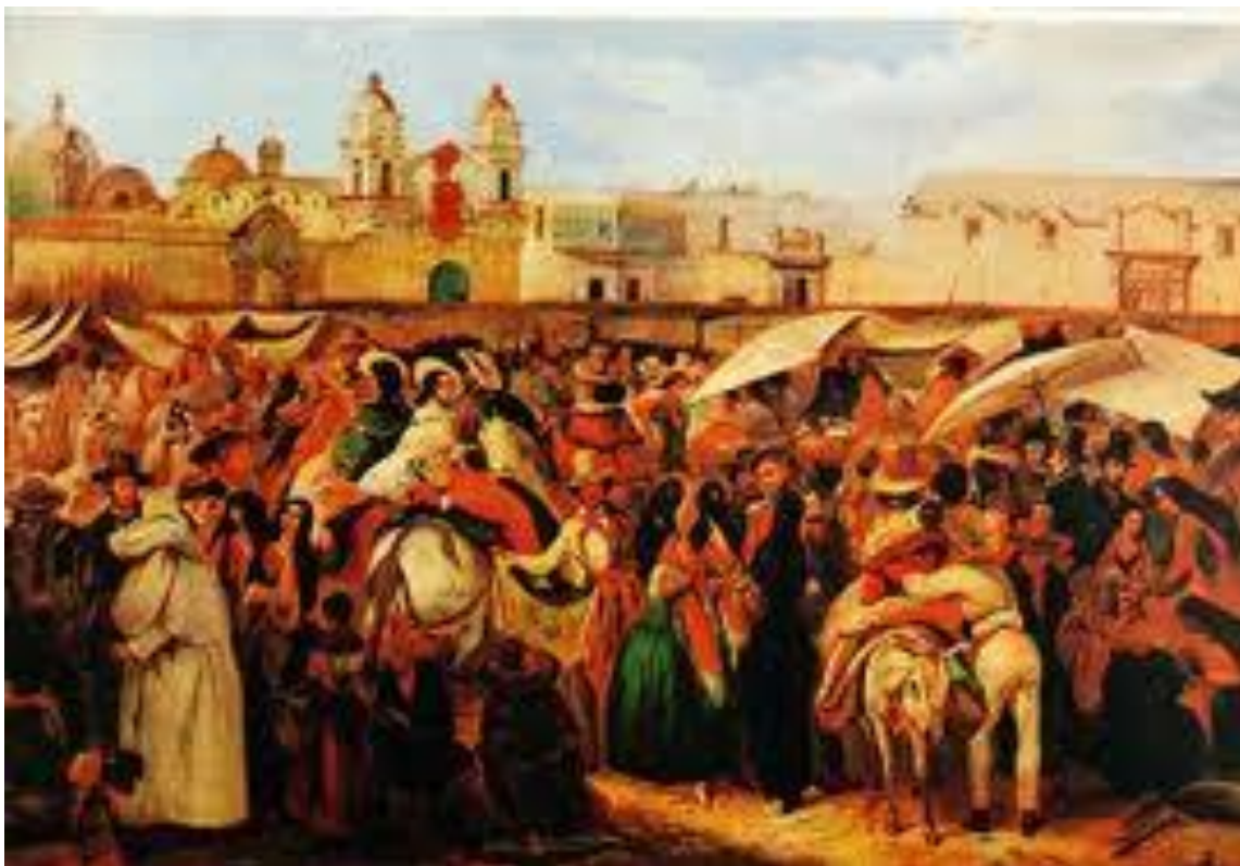
Plaza de la Caridad – Plaza de la Inquisición.