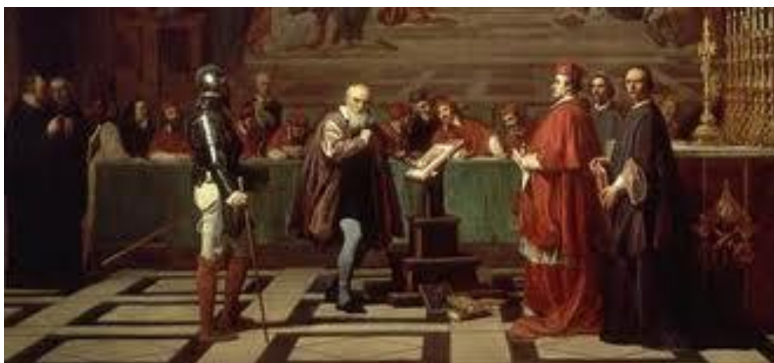
LA SANTA INQUISICIÓN EN EL PERÚ.

Durante las primeras décadas del tribunal limeño (1569-1600), fueron condenados a muerte y ejecutados 13 reos; luego (1601-1640) fueron justiciados 17, y a partir de entonces sólo hubo un caso en 1664 y otro en 1736. De estas 32 víctimas, 23 fueron procesadas por judaizantes 7 , 6 por protestantes, 2 por explícita herejía y un caso de "alumbrado" o falsa santidad.