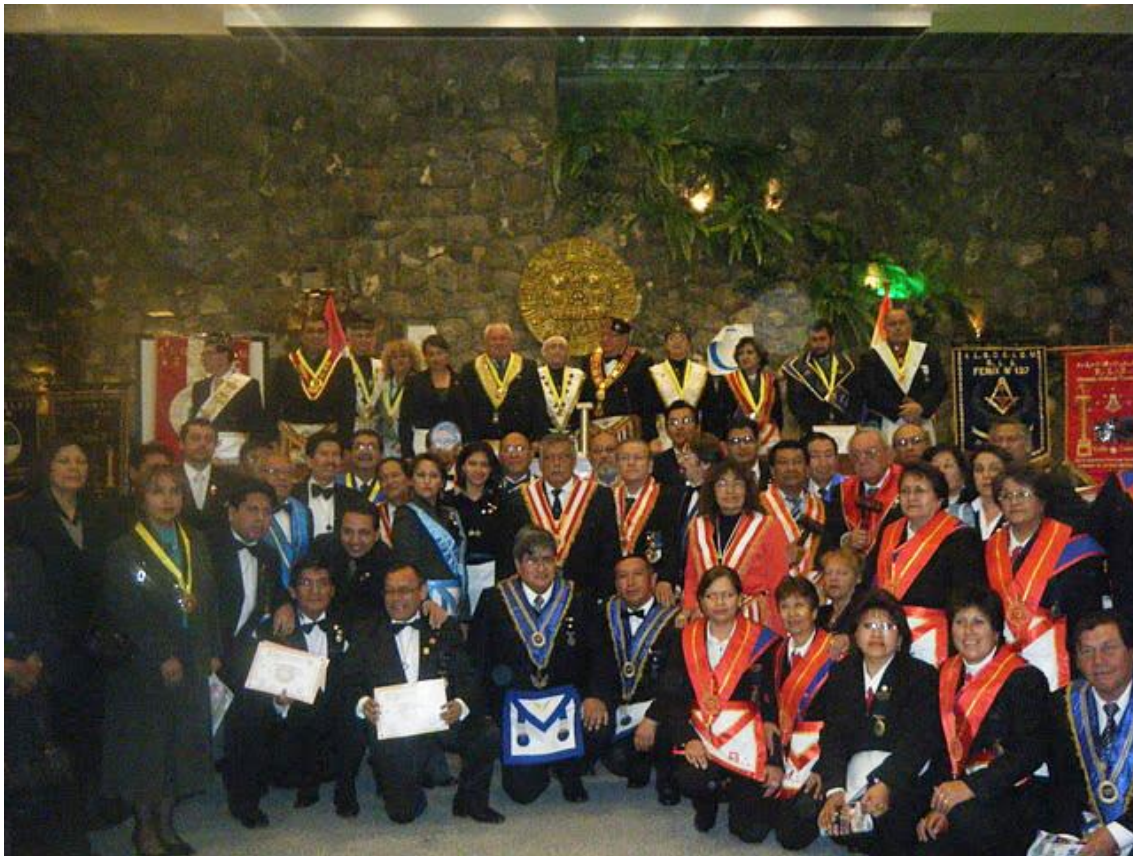
Masonas de Illary N° 4 y Clorinda Mattos N° 12 y Masonas y Masones de Francia, Rumania, México y Perú asistentes al I Congreso Mundial de la Masonería Moderna y Liberal realizado en julio del 2010 en el Cuzco.

diferentes partes como por ejemplo en el Cuzco la R.:L.:S.: Clorinda Mattos, en Lima R.:L.:S.: Illary que son logias mixtas. El Triangulo Masónico Mampira de la Merced-Chanchamayo viene trabajando para constituir una logia de mujeres.