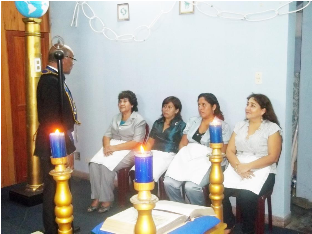
Masonas de Mampira N° 23, recepcionando instrucciones de un maestro masón.

El Triángulo Masónico Mampira N° 23 es apadrinada por la Logia Fenix 137-1 jurisdiccionada a la Gran Logia Constitucional del Perú, quienes apoyan la conformación hasta que levanten columnas, luego del cual ellas en plenitud de sus derechos y obligaciones encaminaran sus usos y costumbres, como logia de mujeres.