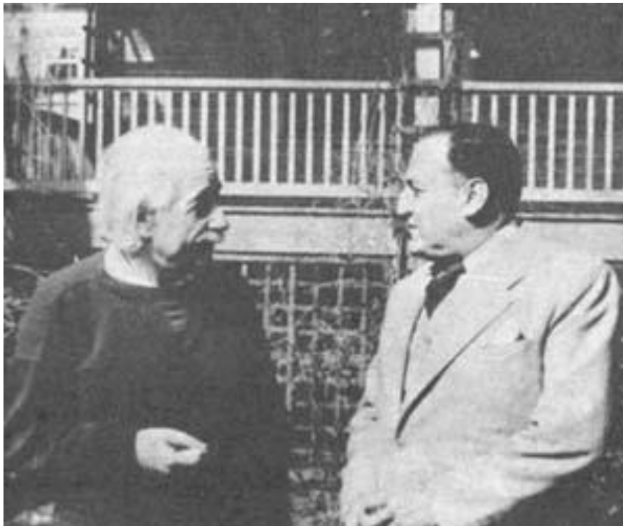
Albert Einstein y Haya De La Torre.

El desarrollo social de todos los pueblos no es simultáneo ni uniforme, y tampoco se puede aplicar a todos un idéntico itinerario. Cada sociedad humana tiene su intransferible velocidad evolutiva referida al espacio en que vive y trabaja. Un espacio geográfico deviene a “ espacio histórico ” cuando el hombre lo puebla e implementa en él un sistema organizado de producción y gobierno.