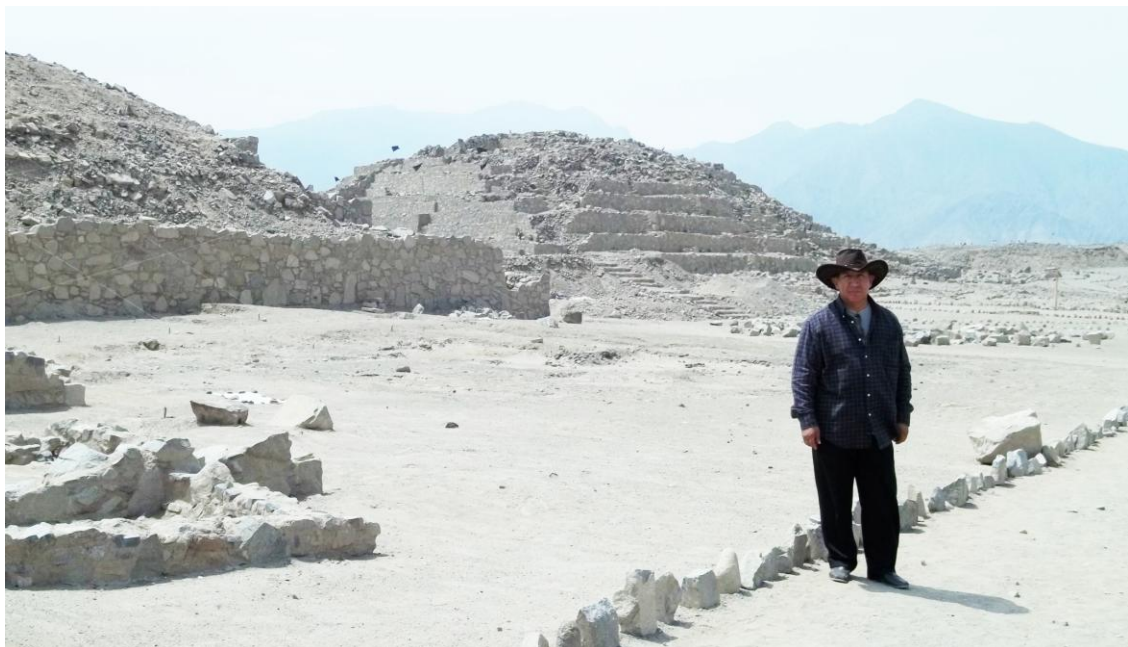
Las mastabas de las pirámides de Caral.

Las pirámides de Sumeria eran de ladrillo cocido, que se apilaban formando mastabas, que se iban superponiendo hasta alcanzar varios pisos. En la cultura Sican se hizo de similar forma con adobes de barro y paja construyendo las pirámides de Túcume y otras en el norte peruano.