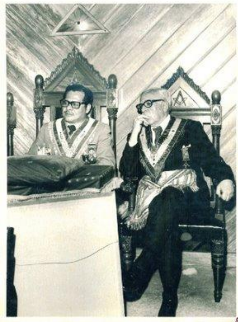
Luis Alberto Sanchez.